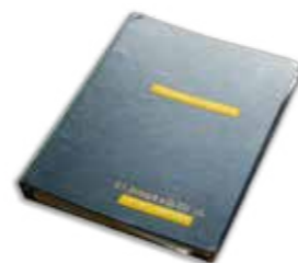
Personalliggaren samlade data om personalen

– Själva datorn var stor som en oljetank men hade en bildskärm som motsvarade dagens Smartphones, säger Per-Olov.