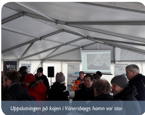
Uppslutningen på kajen i Vänersborgs hamn var stor