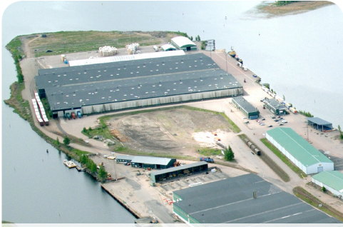
Området innan anläggning av nya containerterminalen

SPEDITION • KLARERING • LAGRING • GODSBEARBETNING • PAKETERING • OMLASTNING