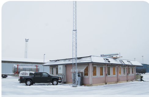
Vänerexpressens kontor på plats i sin nya position