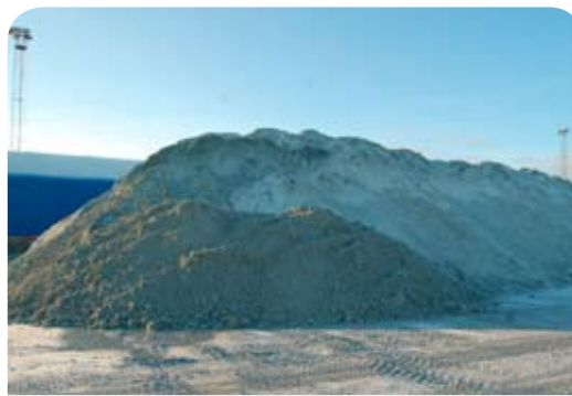
Mesan mellanlagras utomhus