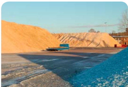
Den nya bulkhamnen är stor, totalt mer än 50 000 m 2