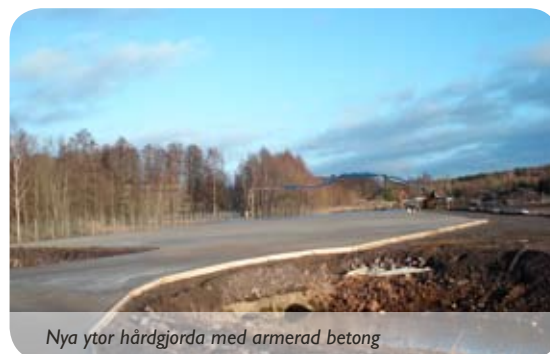
Nya ytor hårdgjorda med armerad betong

Under hösten har även hamnområdet utvidgats och omgärdats med nytt staket. En yta på över 3 000 m 2 har dessutom hårdgjorts och ytbelagts med en armerad betongplatta. Ytan skall användas för mellanlagring och bearbetning av skrot.