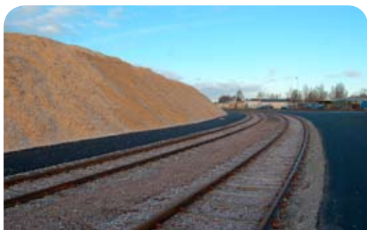
Mer än 2 km järnvägsräls har anlagts på Wermlandskajen

Nya bulkhamnen fullbordar omstruktureringen av Karlstads hamn. Den "nya" hamnen får ett nytt och bättre transportflöde med förutsättningar att klara inte bara dagens, utan även framtidens logistikkrav.