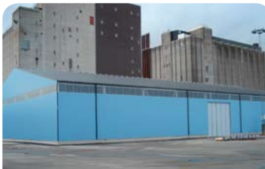
Lidköpings nya bulkmagasin

Den nya lagerbyggnaden är konstruerad med "stöttåliga" betong- och plankväggar och med en inre takhöjd på över 10m, vilket möjliggör tippning av lastbilar inomhus. Det nya bulkmagasinet, som är det mest ändamålsenliga av alla magasin i Vänerhamn, kommer att slutbesiktas före jul och tas i drift direkt därefter.